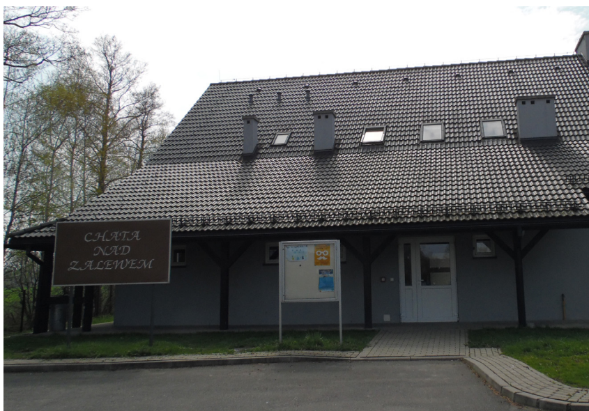
Chata nad zalewem

Świetlica ulokowana jest w „Chacie nad Zalewem” – obiekcie łączącym w sobie możliwość organizacji spotkania warsztatowego, integracyjnego i okolicznościowego, połączonego z odpoczynkiem oraz wsłuchaniem się w odgłosy otaczającej przyrody. Budynek powstał w 2012 r. i posiada nisko osadzoną konstrukcję dachu przywołującą na myśl wiejską architekturę oraz taras z widokiem na plac zabaw dla dzieci. W jego wnętrzu mieści się sala na 50 osób i zaplecze kuchenne o charakterze cateringowym umożliwiającym skorzystanie z usług wybranych przez użytkownika firm cateringowych lub przygotowanie menu we własnym zakresie. „Chata nad Zalewem” jest miejscem