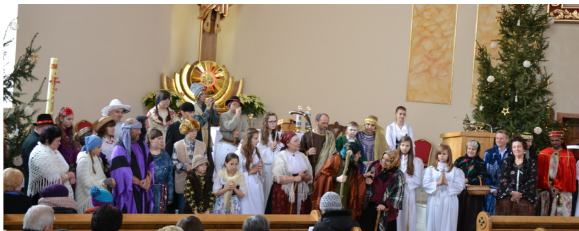
grupa Szpasowici wystawiła jasełka w zbytkowskim kościele