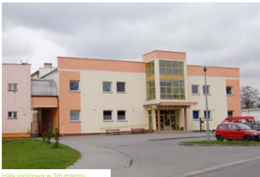
Hala sportowa w Strumieniu