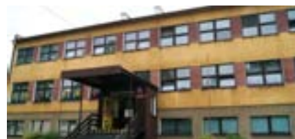
Przedszkole Publiczne w Strumieniu