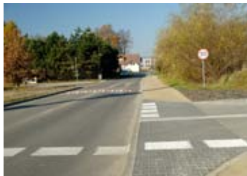
Rzeczowa realizacja inwestycji 28 marca 2011r – 30 listopada 2011r